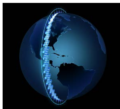
(イメージ図) 衛星コンステレーション 2022 年頃までに数十機を軌道上で運用 (予定)

技術発展に伴う衛星の小型化や、廉価な衛星打ち上げサービスの拡大、さらには IoT ビジネスの活性化を背景に、2027 年頃までに全世界で約 7,000 機以上の小型衛星の打ち上げが予想されています。 ※3 アクセルスペースは、一日に一回、世界中どこでも、高画質で均一な画像を撮影できる技術的優位性を有し、またそこから得られる解析データもアクセルスペースの持つ大きな強みと言えます。